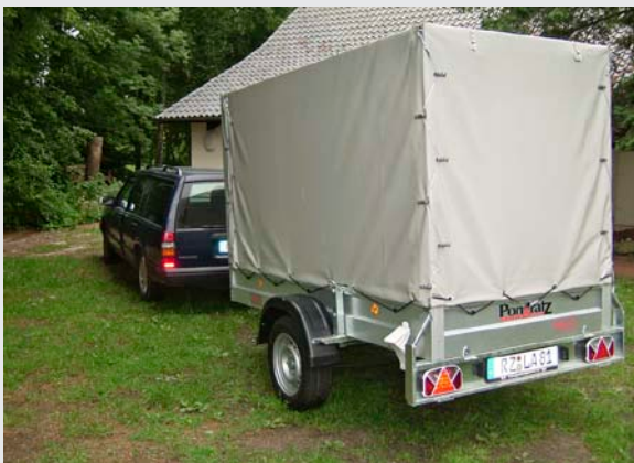
Anhänger mit 40 Stühlen

Haupthaus so sehr bewährt hat, ist vielleicht eine Grundsanierung des Bodens im Speiseraum ebenfalls sinnvoll. Natürlich: eine neue Auslegeware ist teuer, aber eine Bodensanierung erfordert noch mehr Mittel. Denkbar wäre ein neuer Boden z.B. aus Bambus – härter und haltbarer als Eiche und ökologisch sinnvoll, weil ein gut nachwachsendes Material. Denkbar wäre eventuell auch eine Auslage mit Linoleum. Beides für einen Raum, in dem gegessen wird, durchaus vernünftige und hygienisch einwandfreie Varianten: schnell und einfach zu reinigen, Flecken bei Malheurs rasch zu entfernen, eine warme Ausstrahlung. Beide Varianten erfordern jedoch einen neuen Unterbau, diese Kosten kämen also hinzu. Wir würden diese Sanierung ger-