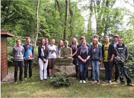
Ein Ausflug in das Haus der Stille – offensichtlich mit viel Freude

entwickelt. Inzwischen ist er 78 Jahre alt und möchte sich etwas aus dem aktiven Lehrerdasein zurückziehen. Wir werden uns am 2. Juni 2012 am Ende seines Seminars mit einer Feier von ihm verabschieden.