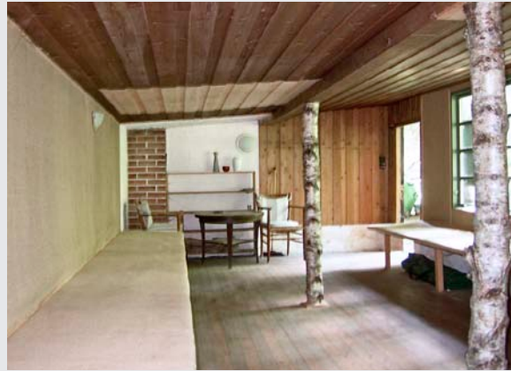
So sieht es aus, wenn Neues sich in Altes einfügt – die Patina der Jahre wird schon noch kommen

Die Stühle , die seit Jahren während Vesakh in der Halle stehen und zunehmend von Meditierenden genutzt werden, waren wackelig geworden – sie sind inzwischen durch neue ersetzt worden. Die Dachverkleidung am Haupthaus war morsch – da musste der Zimmermann ran. In einigen Zimmern löste sich die Tapete – da wurde der Maler aktiv. Die alte Klausen hatte ein marodes Dach , was sich deutlich sichtbar an der Decke zeigte – da musste der Dachdecker seine Kunst beweisen. Im Damenwaschraum im Haupthaus fiel das Fenster beinahe aus dem Rahmen. Es wurde noch gerade rechtzeitig bemerkt, inzwischen ist es durch ein neues ersetzt worden. Immer wieder fallen Transporte an und es hat sich herausgestellt, dass es sehr praktisch wäre, diese ohne Probleme durchführen zu können. Seit Juni steht ein Anhänger für den Transport von so Allerlei zur Verfügung: Als erstes wurden die 40 neuen Stühle damit abgeholt. Schließlich erleichtert seit einigen Monaten ein elektrischer Gemüseschneider den Küchenfeen ihre Arbeit.