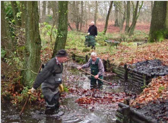
Zwei im Teich