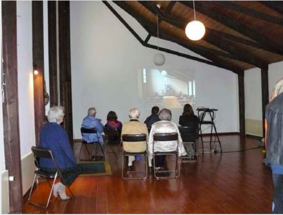
In der Halle

Ein-Blicke – Rück-Blicke Erinnerungen Gegenwart stille werden so nah – so fern Impressionen aus fünfzig Jahren berühren