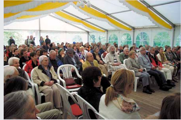
Ein voll besetztes Festzelt

Nahrung für den Geist. Gespannte Aufmerksamkeit, Kein Knistern, kein Husten, nur das Prasseln der Regentropfen im Wettstreit mit den Worten. Gut dass wir im Trockenen sitzen!