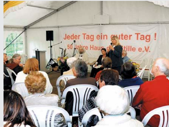
... und viele können etwas beitragen...