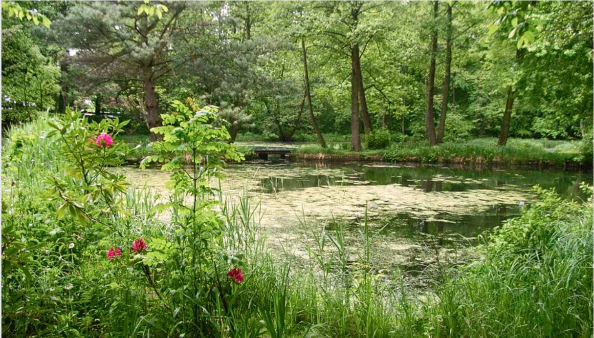
Impressionen in Grün

Einfach mal so Ein Blick zwischendurch So viele Grüns Mit roten Tupfern dazwischen