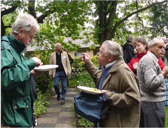
Mittagszeit – volle Teller

Alle lassen es sich gut schmecken, Der Regen macht Pause!